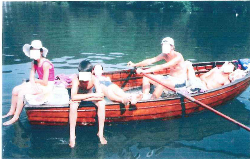
Longueur : 4 mètres – Largeur : 1,60 mètre

qui était amarrée à un ponton, et dont voici une photo :